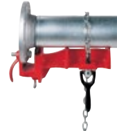
Modèle 461 / 462 / 463 / 464 Etaus pour soudage de tubes en ligne et en angle, pour soudage de coudes et de brides N° de Catalogue 40220 / 40225 / 40230 / 40235