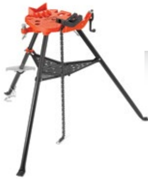
Modèle 460-12 Etau à chaîne TRISTAND® portatif N° de Catalogue 36278

Aucun procédé de préparation de soudage ne sera aussi rapide, propre et précis qu'en utilisant cet outil RIDGID: