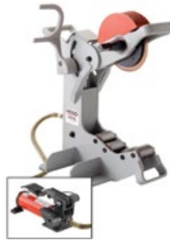
Modèle 258 / 258XL Coupe tube électrique N° de Catalogue 50767 / 58227